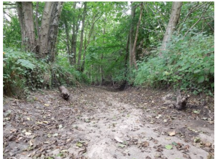
Snoeiyinksbeek, waterschap Vechtstromen, Bas Worm

Op de zoetwaterstand presenteerde ZON een verhaal over de droogte van 2019 in Oost- en Zuid-Nederland. Het neerslagtekort is daar veel groter dan in de rest van Nederland. De noodzaak om maatregelen te nemen om de grondwatervoorraad te vergroten is duidelijk. Dat is een langjarig proces waarvoor samenwerking tussen overheden en particulieren en ook veel geld nodig is. Een Deltaprogramma voor de Hoge Zandgronden als het ware.